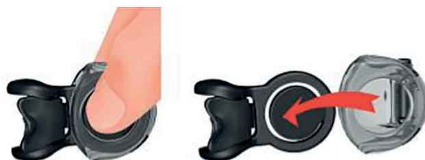
(Abb. 1) 1. 2.